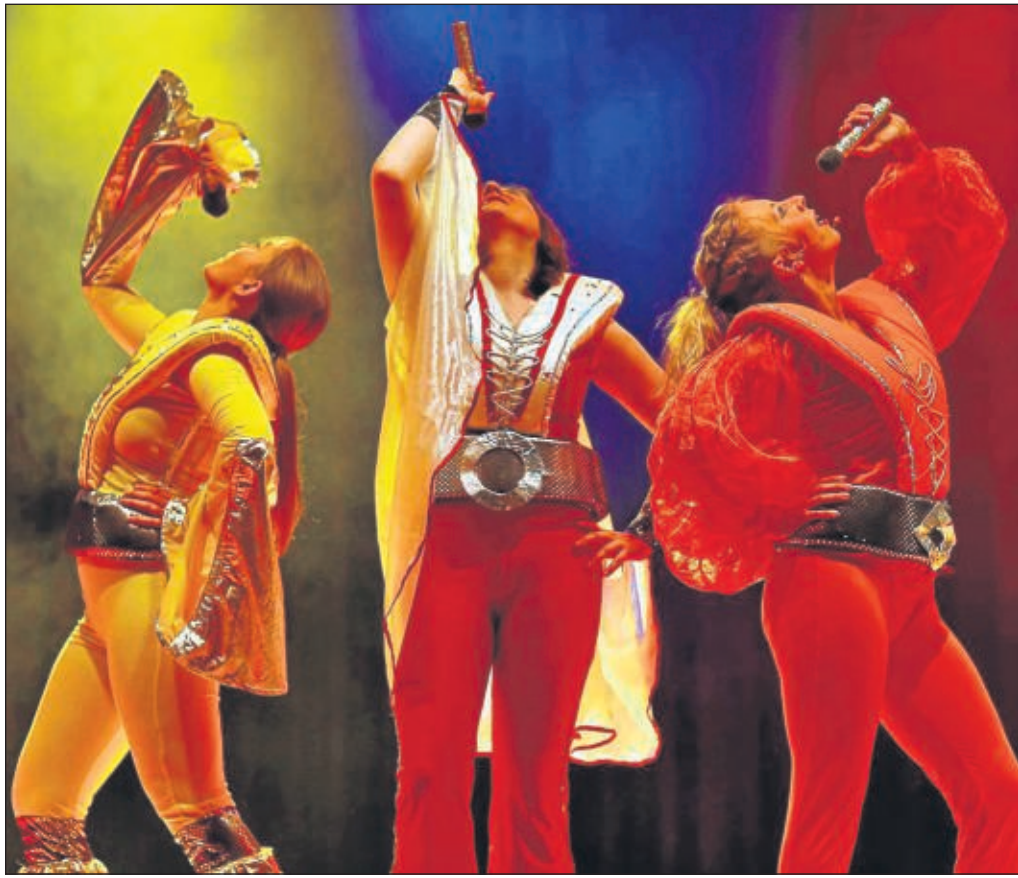
In bekannter ABBA-Pose führte die Hanauer Musicalgruppe Flip-Flops bei der Musicalnacht in Kilianstädten Lieder aus „Mamma Mia!“ auf.

Noch während der Aufforderung an das Publikum, ihnen beim „Tanz der Vampire“ in die Ewigkeit zu folgen, wurde die Bühne in blaues Licht getaucht und aus Nebelschwaden erschienen Vampire. Einige Untote bewegten sich durch das Publikum - so authentisch, dass ein kleines Mädchen im helleren Bar-Bereich des Bürgerhauses Zuflucht suchte. Im ersten Teil der Show wechselten sich poppige Musik wie in „Tanz der Vampire“ mit ruhigeren Parts und romantischen Duetten zum Beispiel aus dem „Phantom der Oper“ ab.